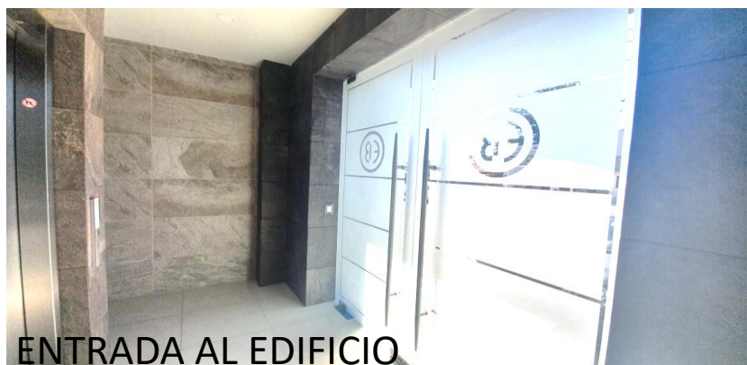
ENTRADA AL EDIFICIO